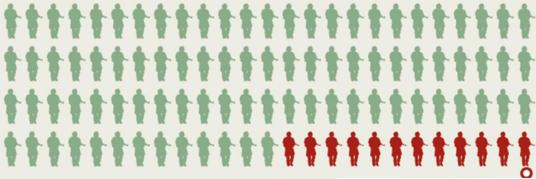
Gráfica 3: Infografía Semana.com